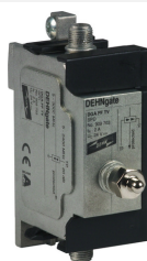
Zobrazení je nezávazné